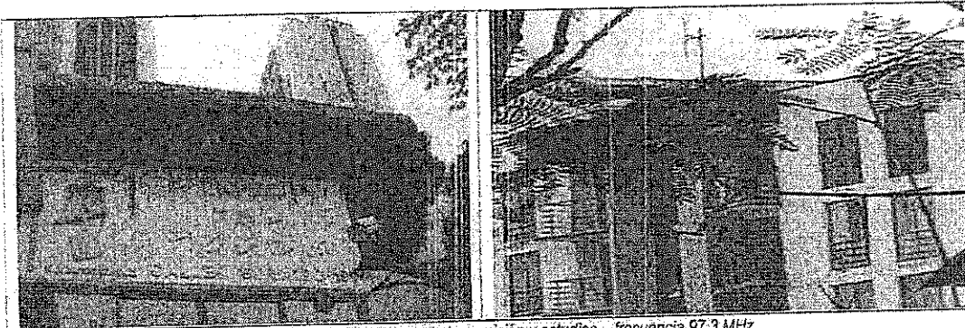
Figura 1. Ubicación sistema de transmisión y estudios – frecuencia 97.3 MHz

Se realizó monitoreo a la banda de radiodifusión sonora en FM el día 8 de noviembre de 2017 evidenciando el uso clandestino del espectro radioeléctrico en la frecuencia FM 97.3 MHz por parte de la emisora denominada La Disco. Se efectuó la radiolocalización del transmisor y estudios de la emisora clandestina en la frecuencia 97.3 MHz los cuales se encuentran ubicados en la calle 9 Sur # 79 C-199 conjunto Pinar del Rodeo de la ciudad de Medellín en las coordenadas N: 06°12'11.6" y W: 75°36'12.3".